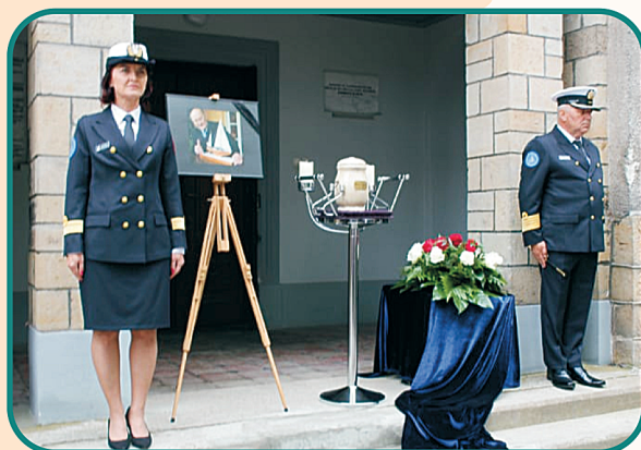
TVP3, Rzeszów 18.30 19.05.2023